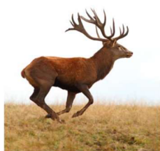
Cerf rouge de Corse