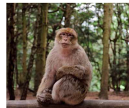
Macaque de Barbarie