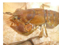
Écrevise à pattes blanches