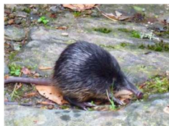
Desman des Pyrénées