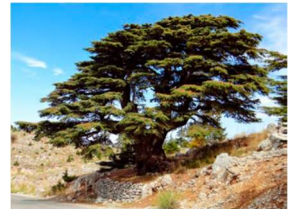
Cèdre du Liban